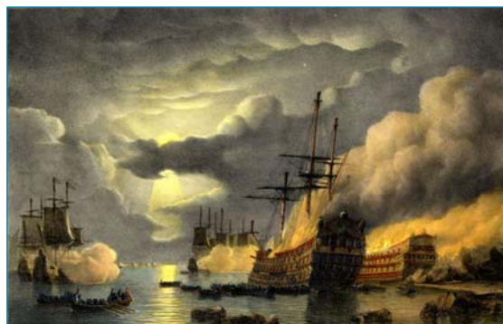
Lithographie de Schotel XIXe. Collection Bibliothèque municipale de Cherbourg.

L'Angleterre, les Provinces-Unies, l'Autriche,